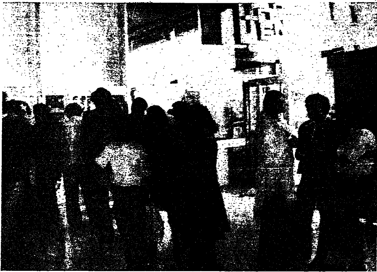
اجيال تنتظر دورها في «الاول يوم بوليسي»

الى ذلك ، فان الممدد يضم كذلك تحت زاوية « وناثق » نص الرسوم الاشرافية رقم 3 تاريخي 8 - 1 - 77 الصادر عن مجلس الوزراء اللبناني بخصوص اثناء مؤسسة وطنية لضمان التوظيفات « الاداري »